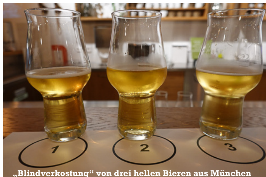
„Blindverkostung“ von drei hellen Bieren aus München

Zum Abschluss der gelungenen Bierverkostung wurden am Thekenrund aktuelle Trends des Münchner Biermarktes diskutiert. Die MBEM Mitglieder begrüßen die stete Erweiterung der in München gebrauten Biere durch Newcomer und auch kleinste Brauereien. Die Bandbreite an handwerklich hervorragend gebrauten Bieren hat sich in den letzten Jahren in München äußerst erfreulich entwickelt. Die Vielfalt blüht. MBEM bedankt sich herzlich für einen einzigartigen Bier-Abend!