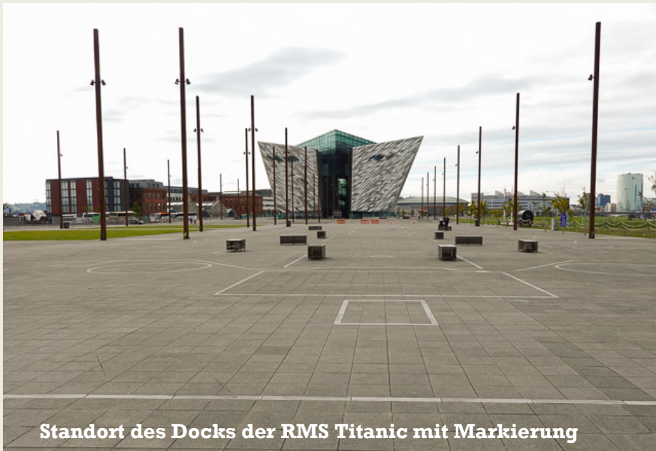
Standort des Docks der RMS Titanic mit Markierung