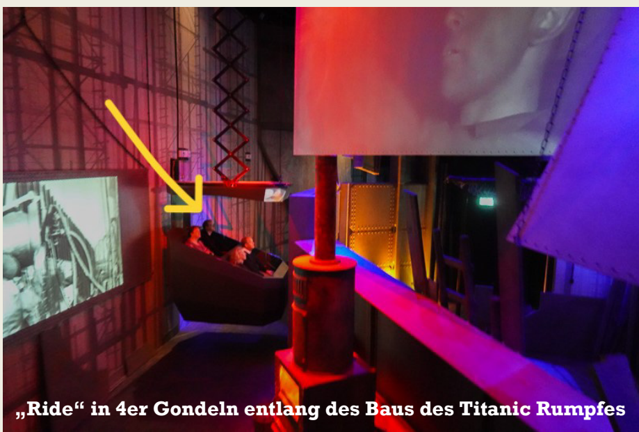
„Ride“ in 4er Gondeln entlang des Baus des Titanic Rumpfes