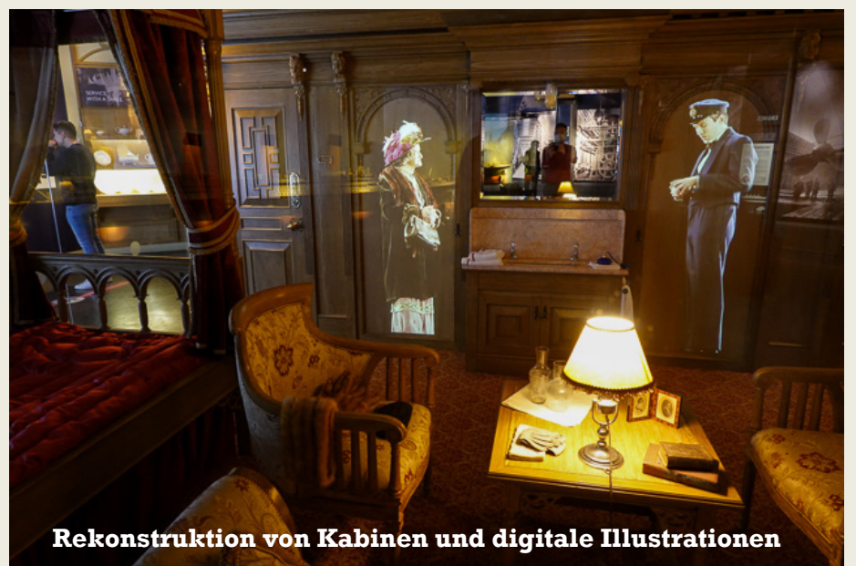
Rekonstruktion von Kabinen und digitale Illustrationen