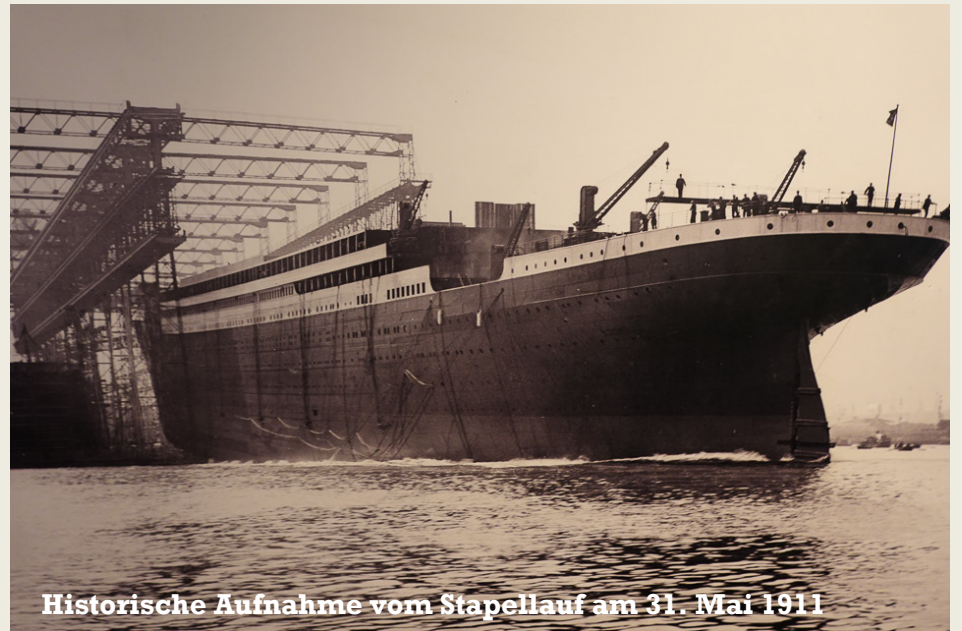
Historische Aufnahme vom Stapellauf am 31. Mai 1911