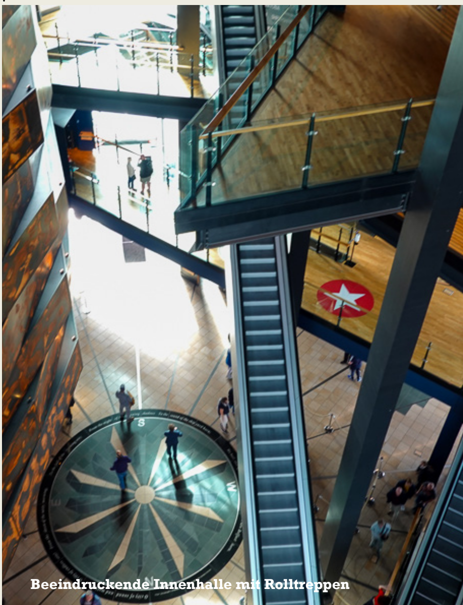
Beeindruckende Innenhalle mit Rolltreppen