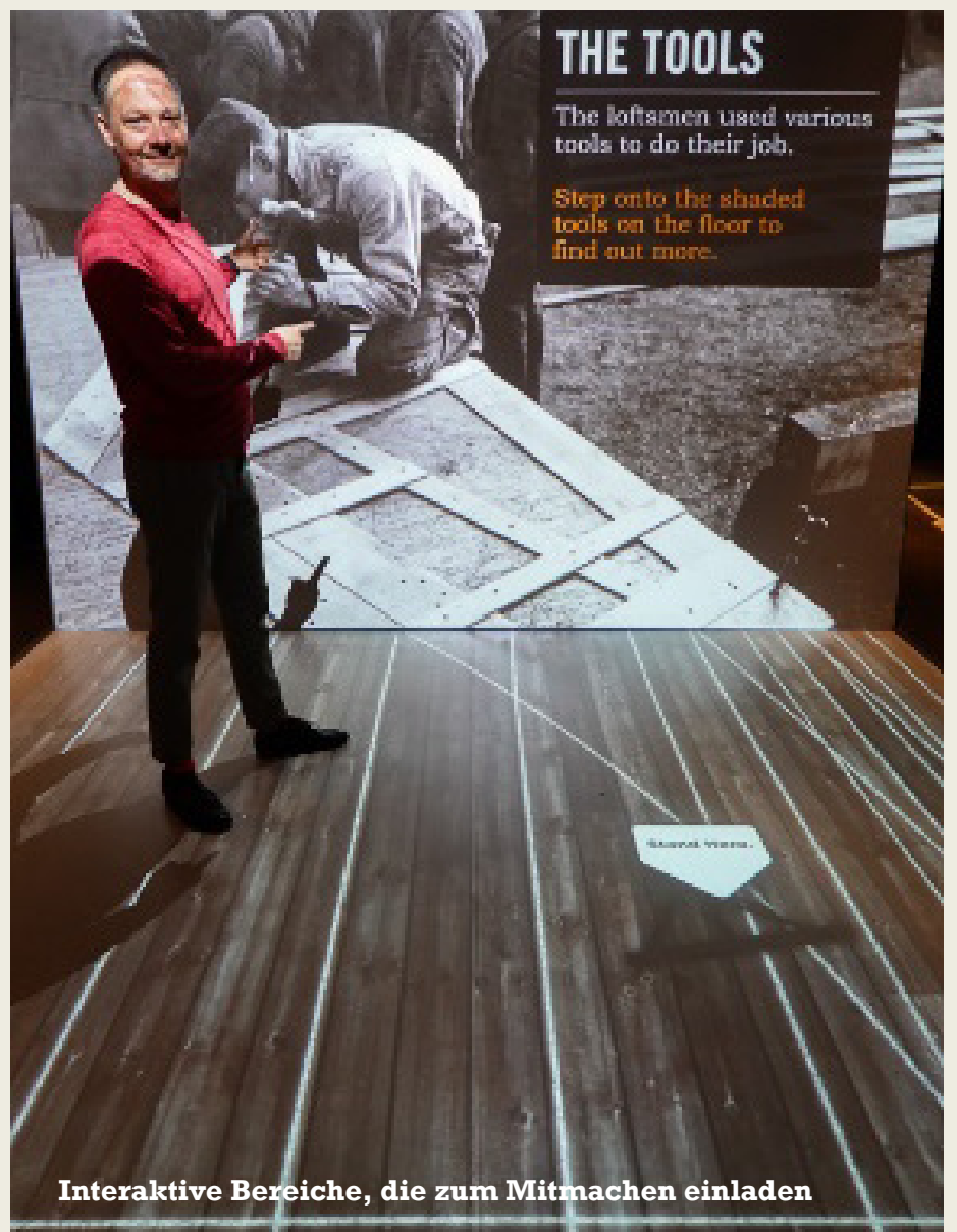
Interaktive Bereiche, die zum Mitmachen einladen