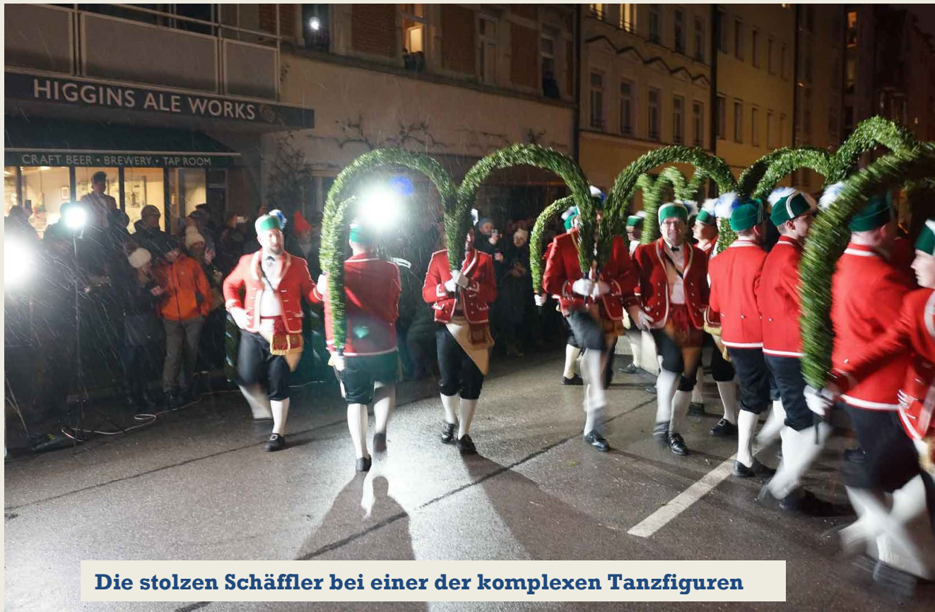
Die stolzen Schäffler bei einer der komplexen Tanzfiguren

MÜNCHEN, MITTEN AUF DER KARLSTRABE, 10. JANUAR 2026