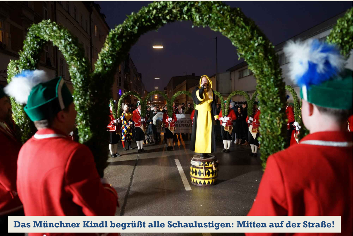
Das Münchner Kindl begrüßt alle Schaulustigen: Mitten auf der Straße!

Teil komplexen Tanzabläufe und Tanzfiguren gemeinsam abgestimmt und professionell erlernt.