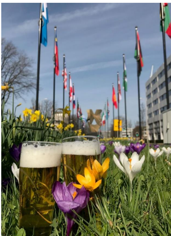
BIERKULTUR: Niederländisches Bier und Blüten an der Fahnen Allee in Den Haag

MBEM bringt Frühlingsknospen zum Erblühen. Im holländischen Den Haag gesellen sich zwei helle Lager unter die Krokusse. Den Haag grüßt mit den Flaggen der Erde alle Menschen. MBEM blickt optimistisch nach vorn und erinnert an eine Zukunft in der wir wieder die Bier Attraktionen der Welt ohne Einschränkungen suchen und erleben können. Egal ob hell, dunkel, klar oder trüb, mit viel oder ohne Alkohol, die Biere der Welt erwarten uns auch in der Zeit nach der Covid-19 Pandemie. Bis dahin gilt es noch etwas Geduld zu üben. MBEM freut sich bereits auf Bier Erlebnisse in der Heimat und in der Ferne!